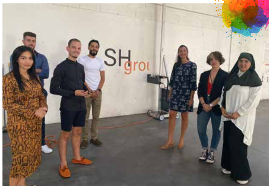
START-UP. Le maire rencontre l'équipe de SH Group

La zone économique de Pincourt accueille depuis cet été SH Group qui ambitionne de révolutionner le secteur de la décoration intérieure et extérieure grâce à des procédés d'impression innovants.