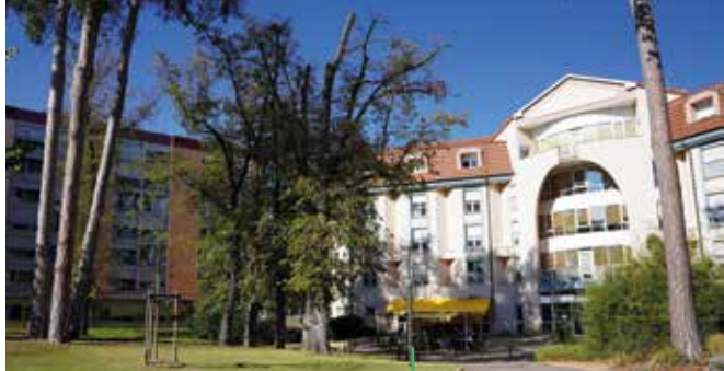
PARC. Foyer résidence et Ehpad