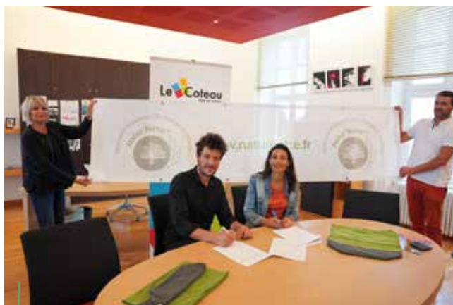
NATUR'NETTE. Partenariat officiel.