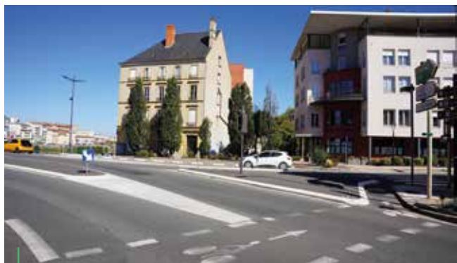
ENTRÉE PONT DE LOIRE. Avant les travaux.

L'entrée de ville par où transitent chaque jour 20 000 véhicules est stratégique. Fin 2020, une phase de sécurisation a permis de réduire le caractère accidentogène et l'idée d'un giratoire, longuement étudiée, a été définitivement abandonnée pour garantir la circulation des convois exceptionnels.