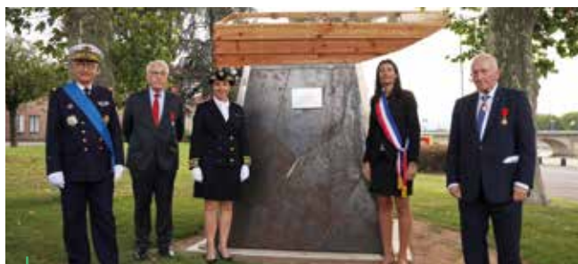
INAUGURATION. Une nouvelle stèle.

Sur le parcours qui a conduit le Conseil municipal à la rencontre des élus de Roanne à hauteur du pont, le maire avec la Préfète de la Loire a inauguré place Pincourt une