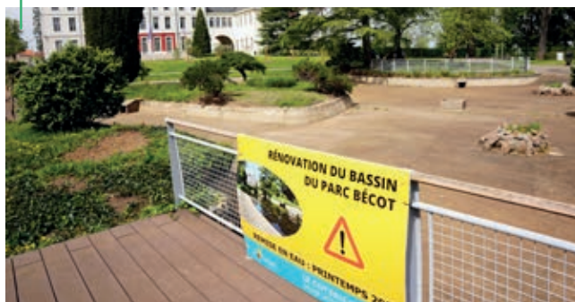
PARC BÉCOT. Restauration et remise en eau du bassin au printemps 2025

Le projet est estimé à 245 000 € TTC. Des demandes de subvention notamment auprès de l'État sont en cours.