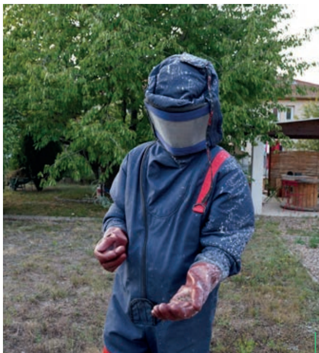
INTERVENTION. Chez un particulier en 2023

Depuis l'an dernier, la commune prend en charge 50 % des frais de destruction des nids de frelons asiatiques, lorsque celle-ci est effectuée par un professionnel chez un particulier. En 2024, une enveloppe globale de 700 € pour les prises en charge est allouée.