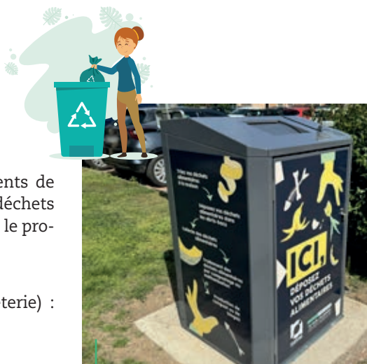
52 ABRIS-BACS. En cours d'installation

Riorges : Les Ateliers solidaires (124 rue Simone Weil, à côté de la déchèterie) : samedi 4 mai de 9 h à 14 h et vendredi 17 mai de 9 h à 13 h.