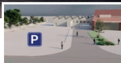
Le nouveau parking - Esquisse provisoire

La salle de spectacle du Coteau aurait dû fêter ses 10 ans l'an dernier, mais entre-temps, la grêle s'est invitée au programme. Les travaux débutent dans moins d'un mois pour une réouverture début 2025.