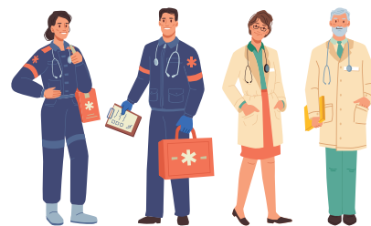
TABLE RONDE SUR LES DÉSERTS MÉDICAUX

Les médecins urgentistes à l'origine du centre de soins non-programmés URG+ du Coteau organisent le 17 mai en mairie une table ronde à propos des déserts médicaux . Ouverte au grand public, elle viendra conclure un tour à vélo en Auvergne-Rhône-Alpes.