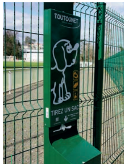
PROPRETÉ CANINE. 23 bornes Toutounet dans la ville

Depuis 2021, quatre espaces pour chiens appelés canisites ont été aménagés rue des Écoles pour les quartiers Balmes-Pincourt, square des Saules pour le Centre, au Margalet pour le secteur des Étines et rue Nouvelle pour Varennes. Leur usage à proximité est obligatoire. Enfin, comme promis, une zone d'ébats pour chiens verra le jour cette année dans le secteur Bousson.