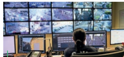
CPU. Centre de protection urbain de Roanne

Si la période hivernale connaît une légère recrudescence des cambriolages, les chiffres restent positifs. Hervé Barge, adjoint à la sécurité publique, rappelle que les vols par effraction ont diminué de 17,14 % entre juillet 2024 et août 2025, plaçant Le Coteau parmi les bons élèves des communes de la circonscription de police. Une preuve de l'efficacité de la politique municipale, qui combine vigilance, technologie et engagement citoyen.