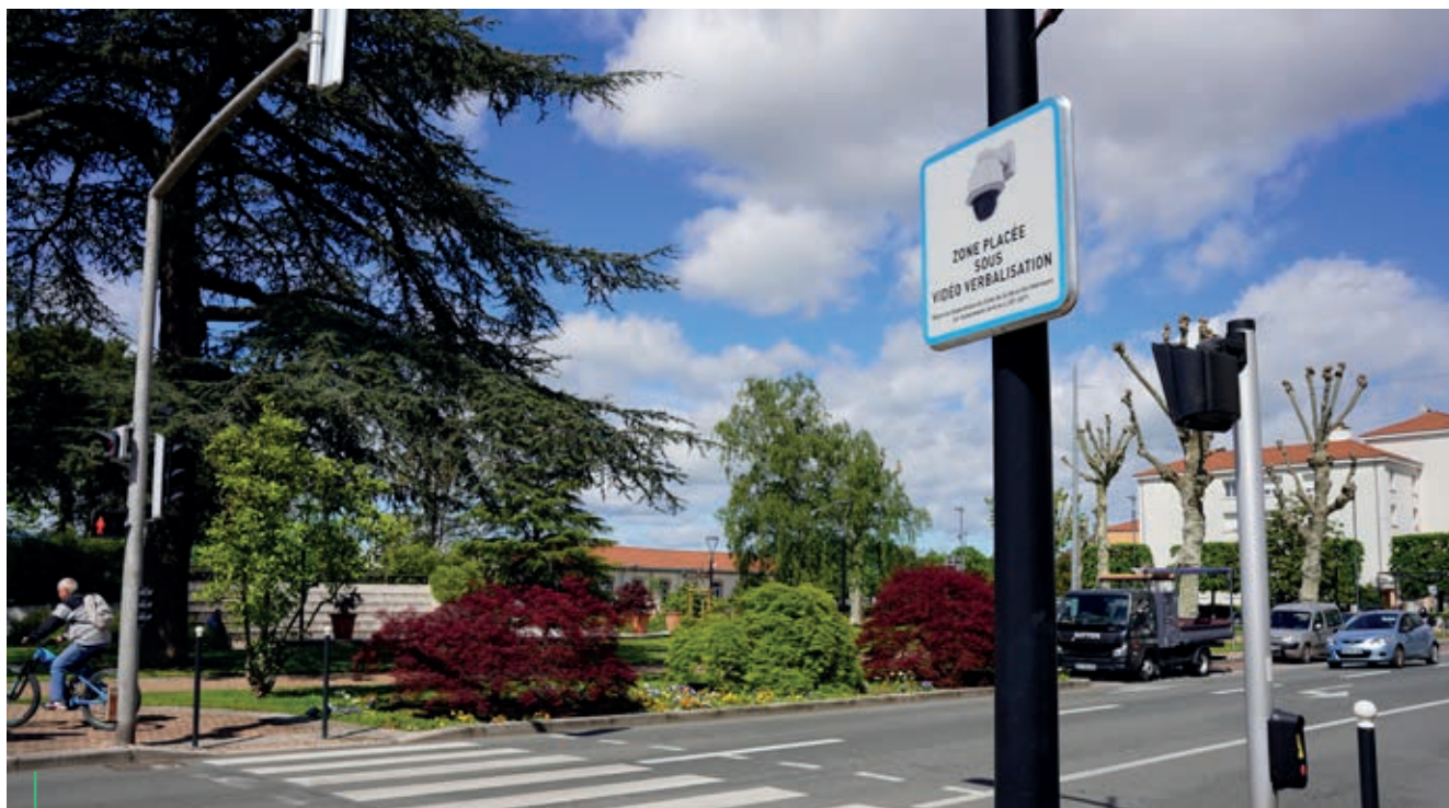
VIDÉOPROTECTION. En 2026, une quarantaine de caméras équiperont la ville.

Cette année, le quartier des Plaines-Varennnes va bénéficier de l'installation d'une douzaine de caméras de vidéoprotection à des points stratégiques. Objectif : renforcer la sécurité des habitants, mieux prévenir et élucider les cambriolages et incidents.